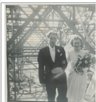
Et brudepar kommer ut fra den kamuflerte kirken etter vielsen. Illustrasjon (mai 1945) fra Kirkekamuflasjen

søk med de tre ordene /avaldsnes bombe kamuflasje/ legger våre to artikler som topptreff. Hva kunne filmen ha blitt tilført av fakta og fortelling dersom Haugalandelevene hadde lest dem? I menyen på vårt