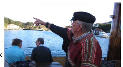
... i Hauskevågen én fabrikk •12 Mølstrevåg Sildolje-fabrikk A/S, Mølstrevåg