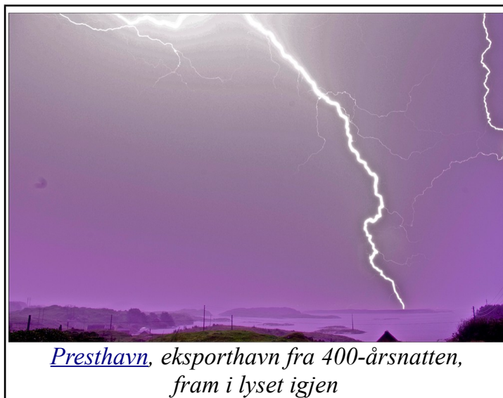
Presthavn, eksporthavn fra 400-årsnatten, fram i lyset igjen

Et slikt landskap med overgrodd historie er strandsonen mellom gardene Sæbø og Torvastad, på vestsiden av Torvastadbygda. Storhavet når ikke inn til land der også Grønningen og prestegarden Haugland når til sjøen, og har fine havnemuligheter. Grønningsjøen med hus og båter, og Presthavn med plass til større fartøyer og travelhet.