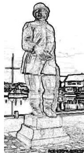
Fisker med hummer og hummerruse, fra Falnes. Originalen står i Nordmandsdalen ved Fredensborg Slot i Danmark, kopi i Skudeneshavn