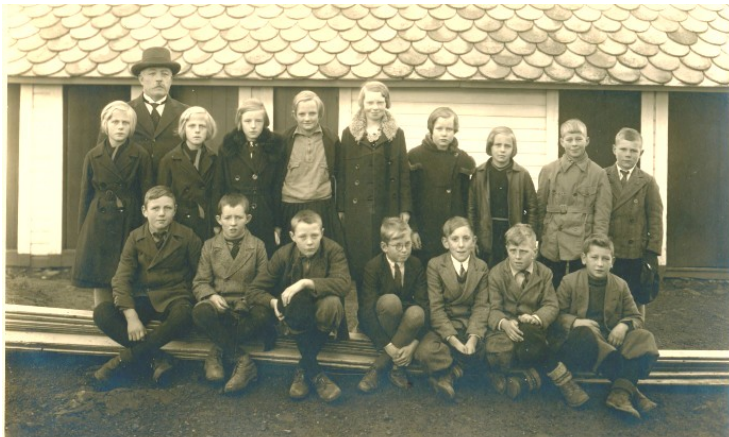
5. klasse 1936

FrØ-bladet 1-09 viste et klassebilde fra Skeie skule, trolig fra 1936.