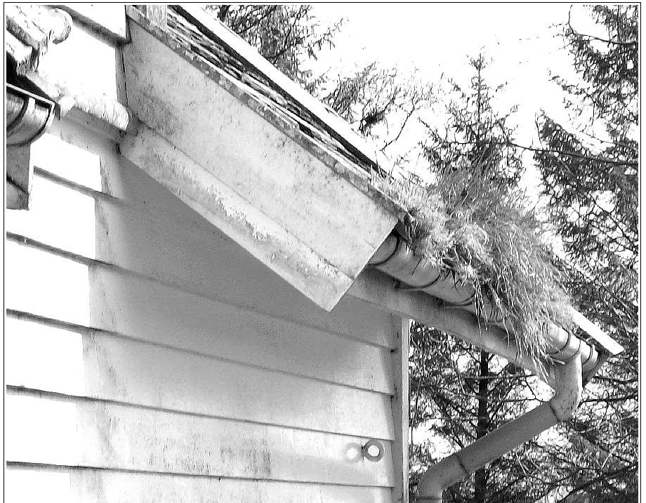
TAKSKJEGG i vekst, helt åpenBART

FrØ-bladet nr 3 – 2008 kommer i september: send stoff / ta kontakt