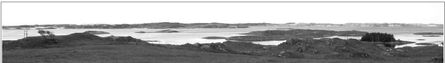
Matrikelgarden Feøy, vest av Torvastad kirke, er en mengde øyer, bl.a. Bjørkevær nesten nord i Røvær (ytterst t.h.)

Husk påmelding til turen innen mandag 9. juni : - sms eller ring til 99 40 20 61 - post@n-kh.no