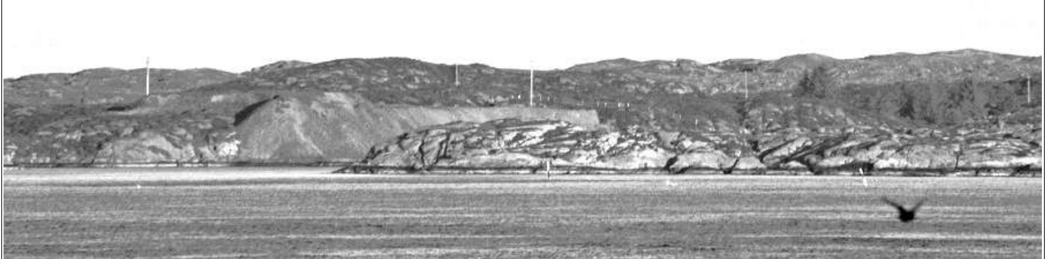
Knut K. Duvøy sprengde ein dag ein bergnabbe vekk. Då fekk han sjå at det var nikkel i fjellet. Kvaløysundet.

*** Huskelappen: Feøytur og noe fra høstprogrammet SE SISTE SIDE ***