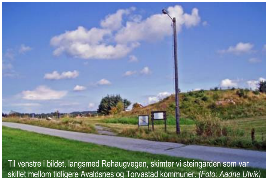
Til venstre i bildet, langsmed Rehaugvegen, skimter vi steingarden som var skillett mellom tidligere Avaldsnes og Torvastad kommuner.