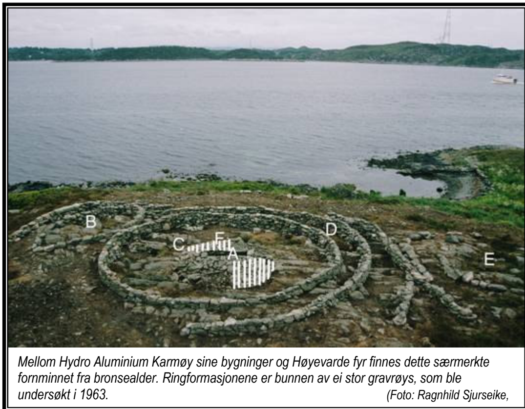
Mellom Hydro Aluminium Karmøy sine bygninger og Høyevarde fyr finnes dette særmerkte fornminnet fra bronsealder. Ringformasjonene er bunnen av ei stor gravrøys, som ble undersøkt i 1963.