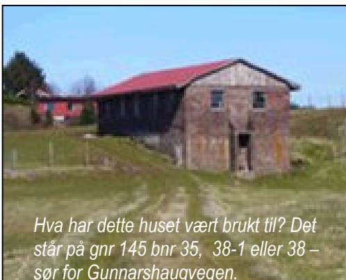
Hva har dette huset vært brukt til? Det står på gnr 145 bnr 35, 38-1 eller 38 – sør for Gunnarshaugvegen.