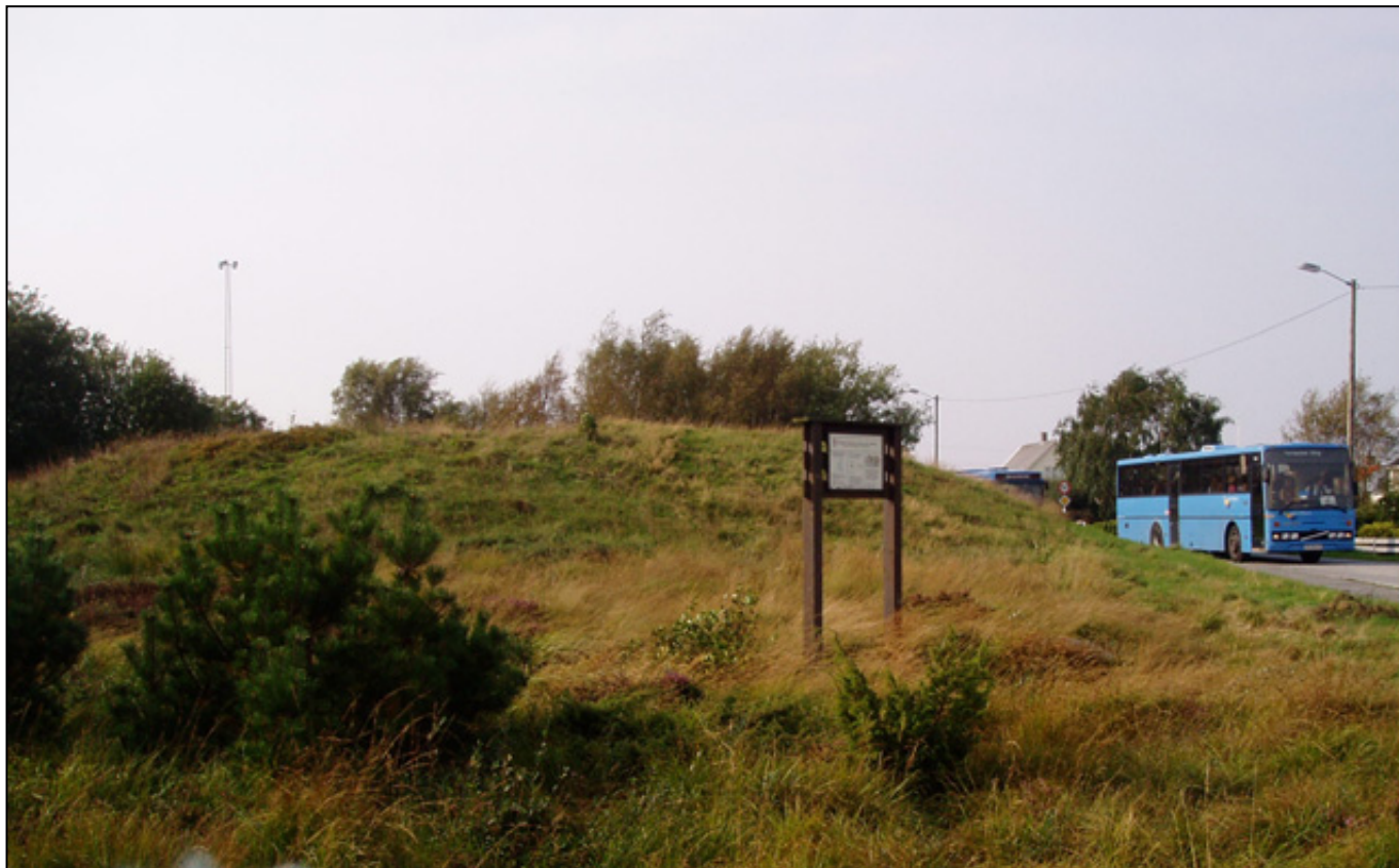
Vårt bilde viser haugen over det berømte skipsgravfunnet i Grønhaug ved ungdomsskolen og folkebiblioteket på Bø.